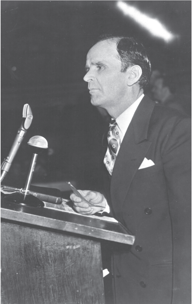
William Marrion Branham